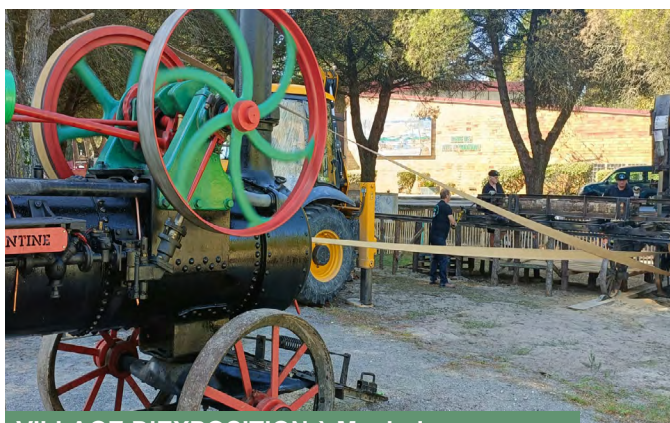
VILLAGE D'EXPOSITION à Maubuisson