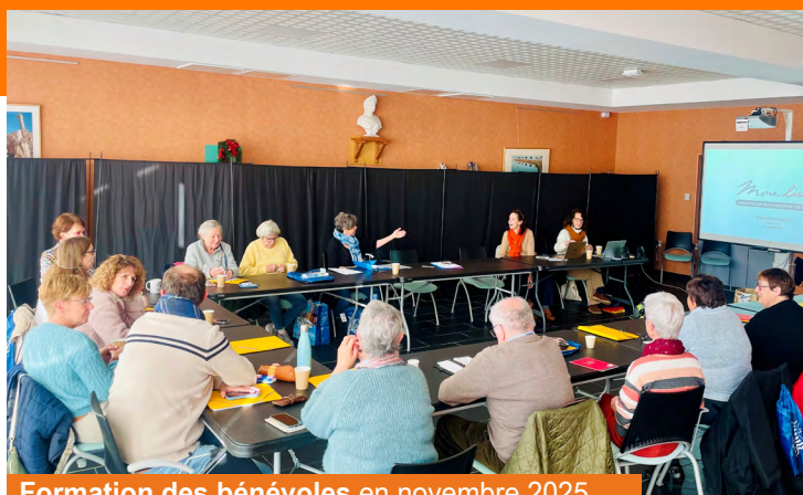
Formation des bénévoles en novembre 2025

Avant de débuter leurs actions, l'ensemble des volontaires a suivi une formation complète, spécialement conçue pour leur permettre d'accompagner au mieux les personnes isolées, tout en respectant leurs besoins, leur rythme et leur intimité.