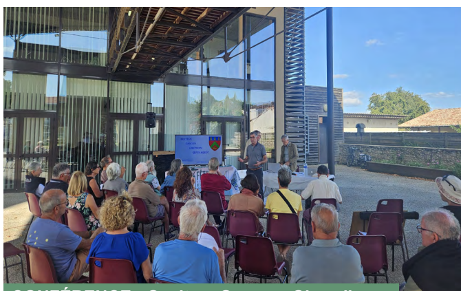
CONFÉRENCE : Occitan, Gascon, Girondin...