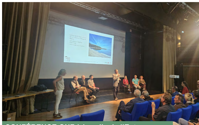
CONFÉRENCE ONF à la salle de l'Estran