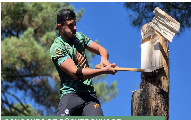
CONCOURS DE BÛCHERONNAGE