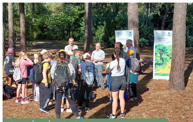
JOURNÉE PÉDAGOGIQUE à Bombannes