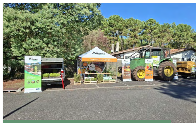
VILLAGE D'EXPOSITION à Maubuisson