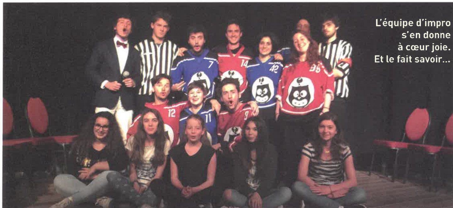
L'équipe d'impro s'en donne à cœur joie. Et le fait savoir...